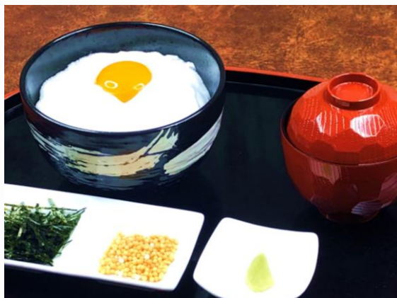
◀ ふわあふわあ 玉子かけご飯