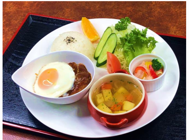
ハンバーグプレート ▶ 1,320円